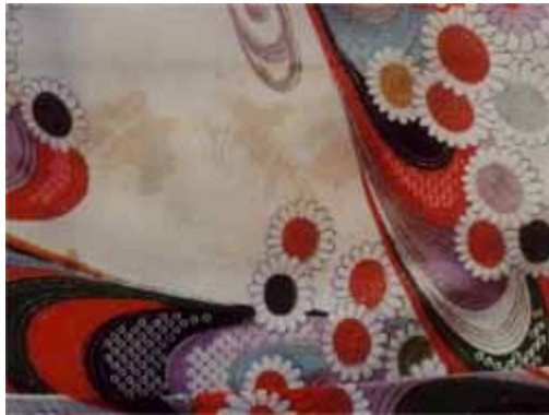
[ 処理前 ]

20年前の経時変化した黄変しみがきれいになります。他のシミでも殆どきれいにする事が可能です。