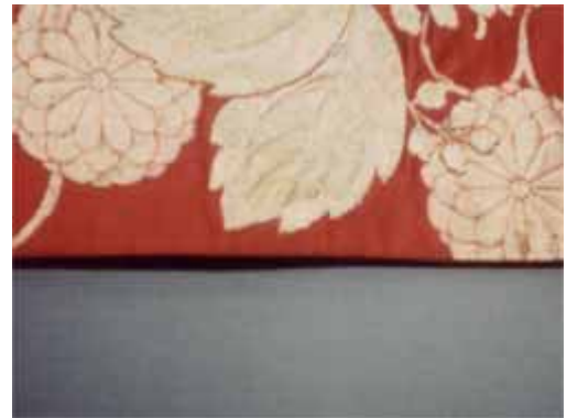
[ 処理後 ]