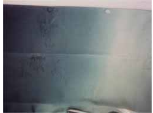
[ 処理後 ]