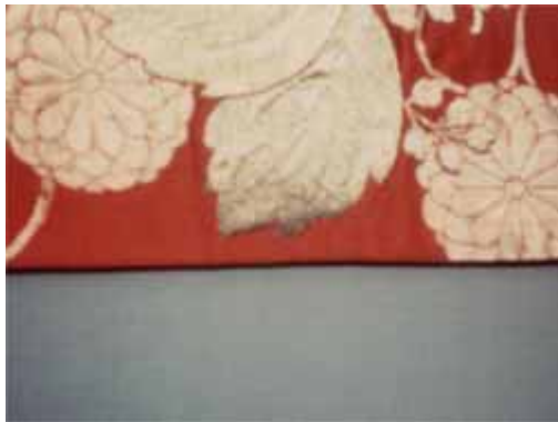
[ 処理前 ]