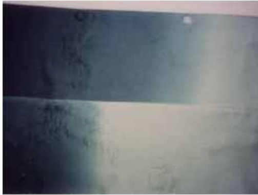
[ 処理前 ]