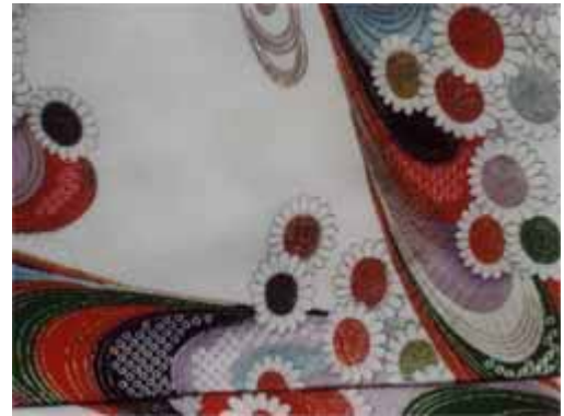
[ 処理後 ]